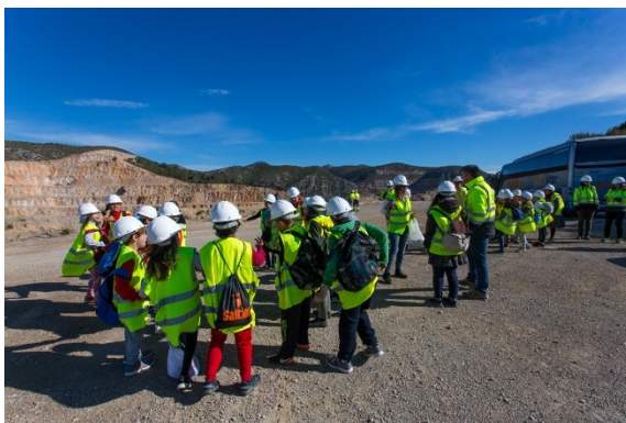
Llegada de los Alumnos a la Falconera.