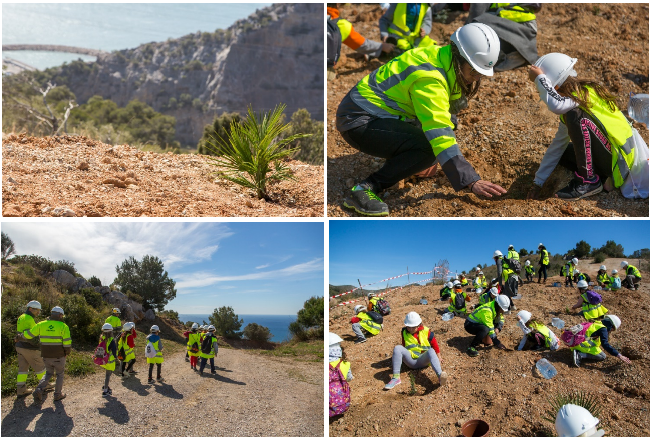
Plantada de especies autóctonas por parte de los alumnos.

Esperamos con ilusión la jornada del año que viene para seguir colaborando en la sensibilización de los más jóvenes respecto a las canteras y a la preservación del medio ambiente.