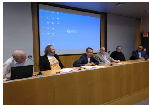
Fotografías de la jornada.